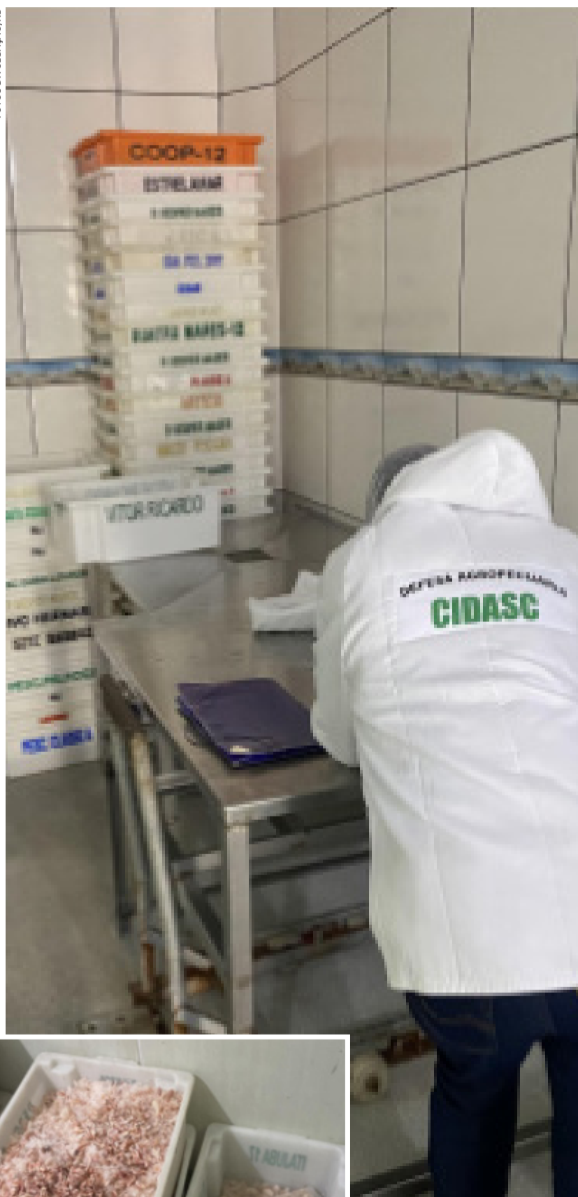
Fiscalização verificou que a empresa não possuía registro nos serviços de inspeção