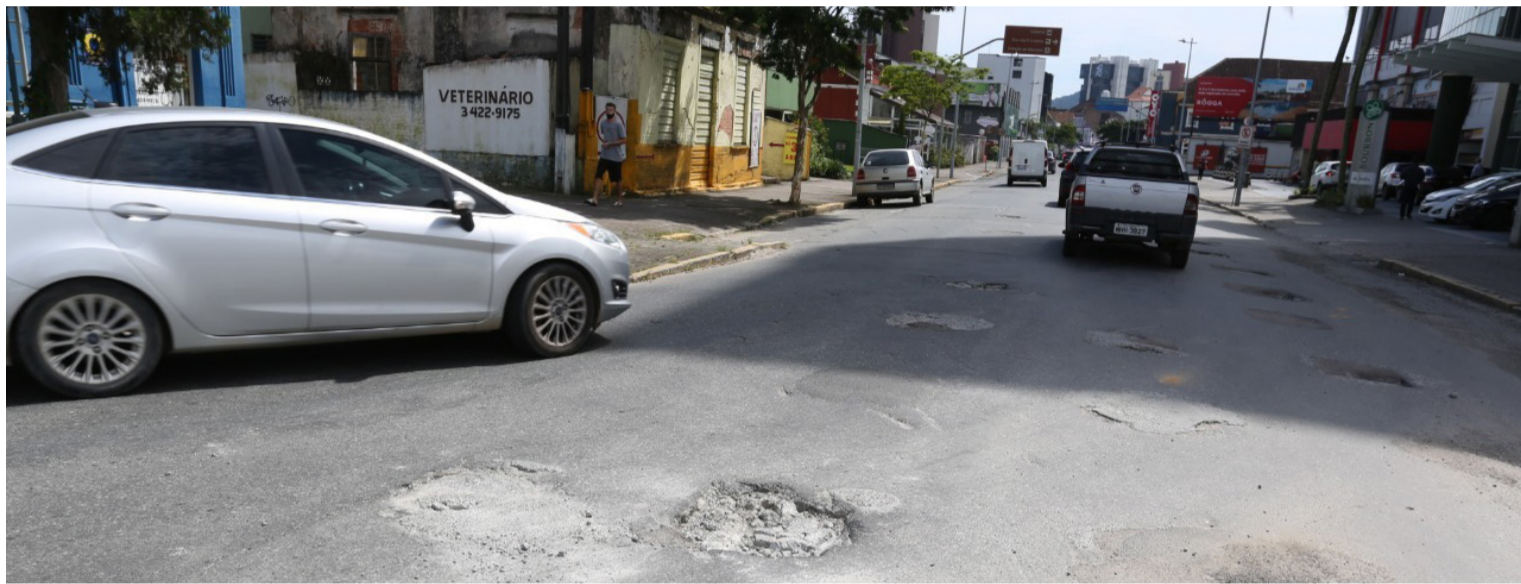
Projeto de macrodrenagem do rio Mathias deixou a pista da Via Gastrômica completamente destruída e agora a Prefeitura vai refazer a parte asfáltica