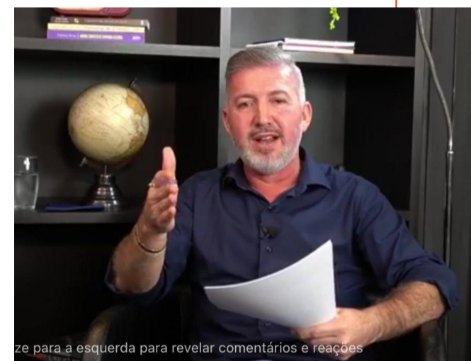
ze para a esquerda para revelar comentários e reações