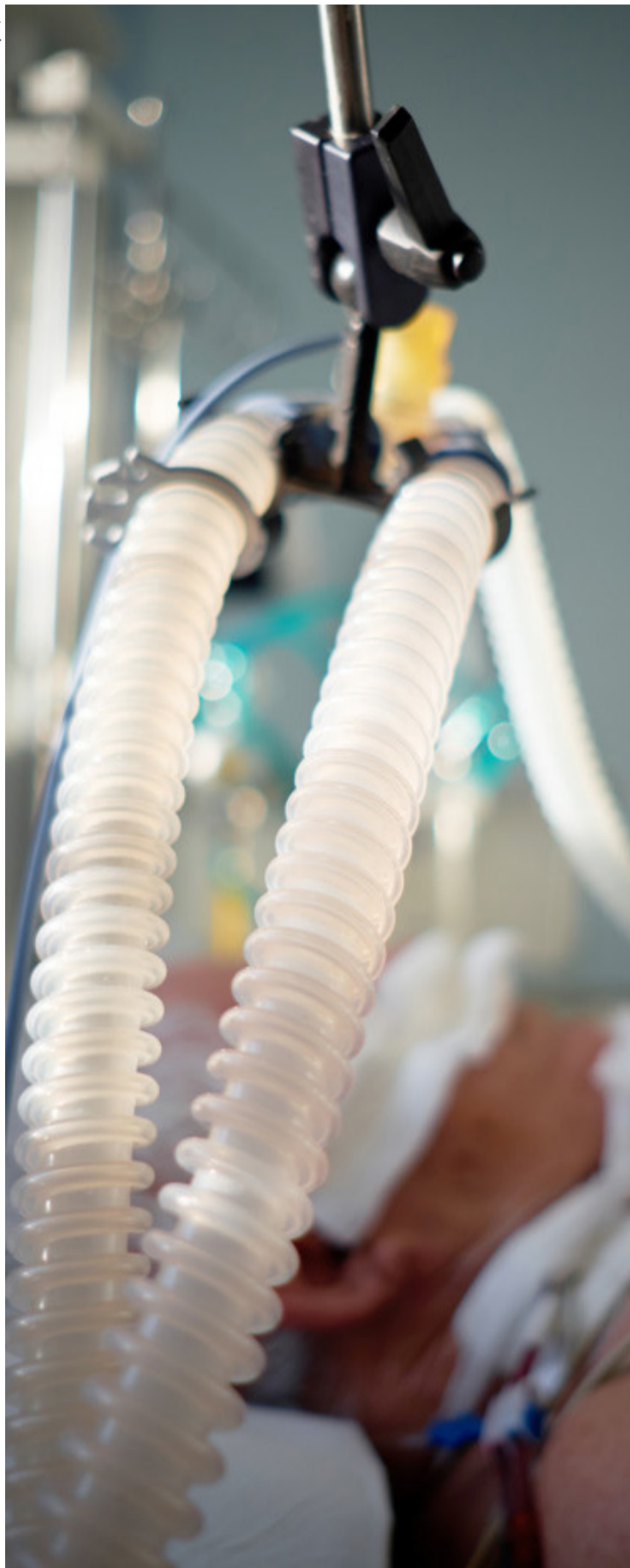
Pacientes internados nos leitos de terapia intensiva são os que correm mais riscos