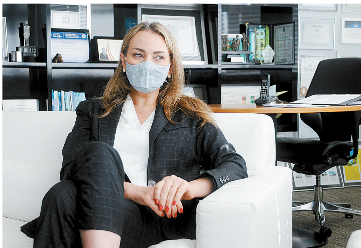
Governadora interina lamenta a crise institucional vivida pelo Estado no momento mas diz estar preparada para governar