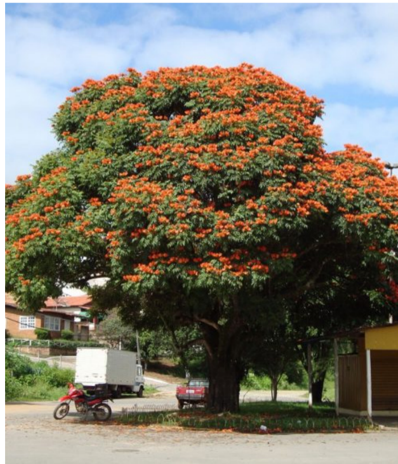
De origem africana, a bisnagueira chama a atenção pela beleza, mas é perigosa