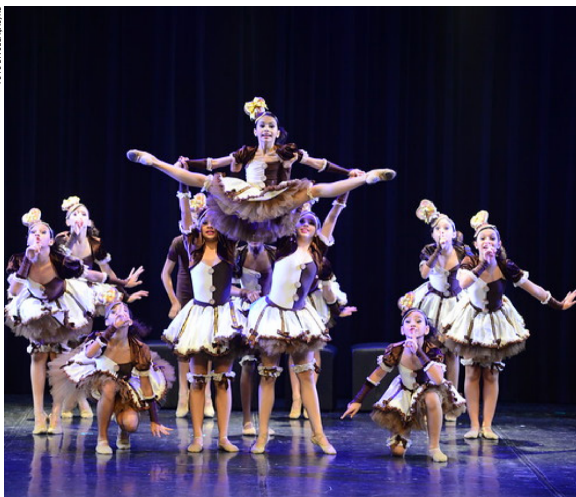
Detalhes da programação do Festival serão divulgados até o mês de agosto, informam os organizadores

Depois de um ano sem contar com o desfile de bailarinos pelas ruas de Joinville, o 38º Festival de Dança, que tradicionalmente é realizado no mês de julho, foi adiado para os dias 5 a 16 de outubro deste ano.