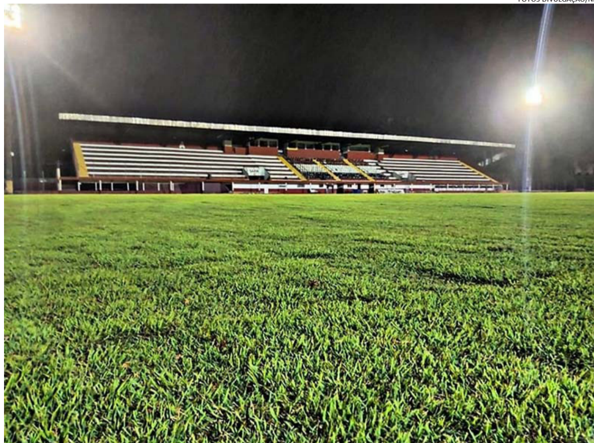
O Juventus segue os preparativos para a Série D e novos reforços devem chegar, na semana que vem, ao João Marcatto