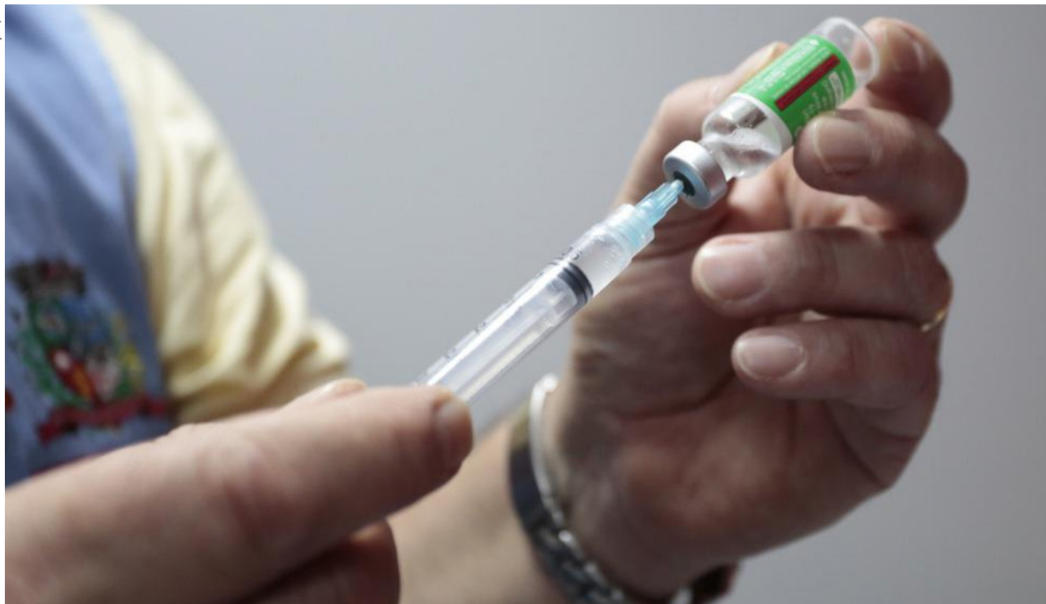
Vacinação iniciada em janeiro vem impactando positivamente, mostra levantamento