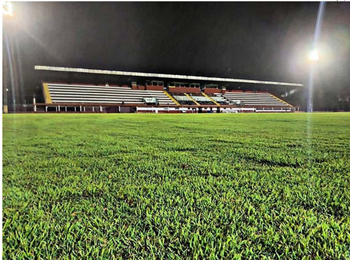
O Juventus segue os preparativos para a Série D e novos reforços devem chegar, na semana que vem, ao João Marcatto