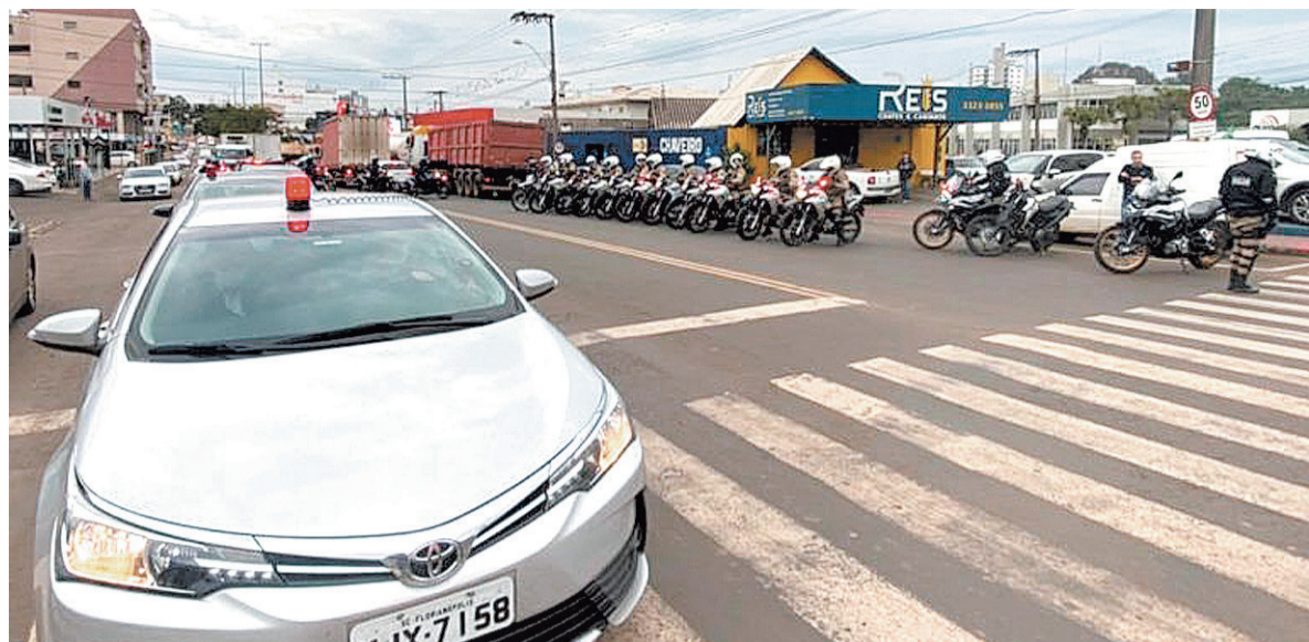
Ontem, forças de segurança percorreram o trajeto pelo qual o presidente irá passar em Chapecó