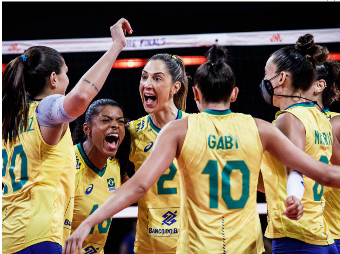
Jogo com o Japão foi difícil. O Brasil teve que virar dois sets para fechar o jogo em 3 a 1

A seleção feminina de vôlei está na decisão do título da Liga das Nações, disputada em Rimini (Itália). Ontem (24), as brasileiras superaram o Japão na semifinal por 3 sets a 1 (25/15, 25/23, 28/30 e 25/16) e enfrentarão os Estados Unidos na final hoje (25), às 14h30 (horário de Brasília).