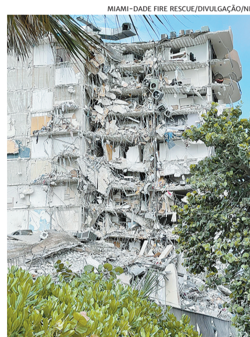
Construção da década de 1980 está localizada em frente ao mar