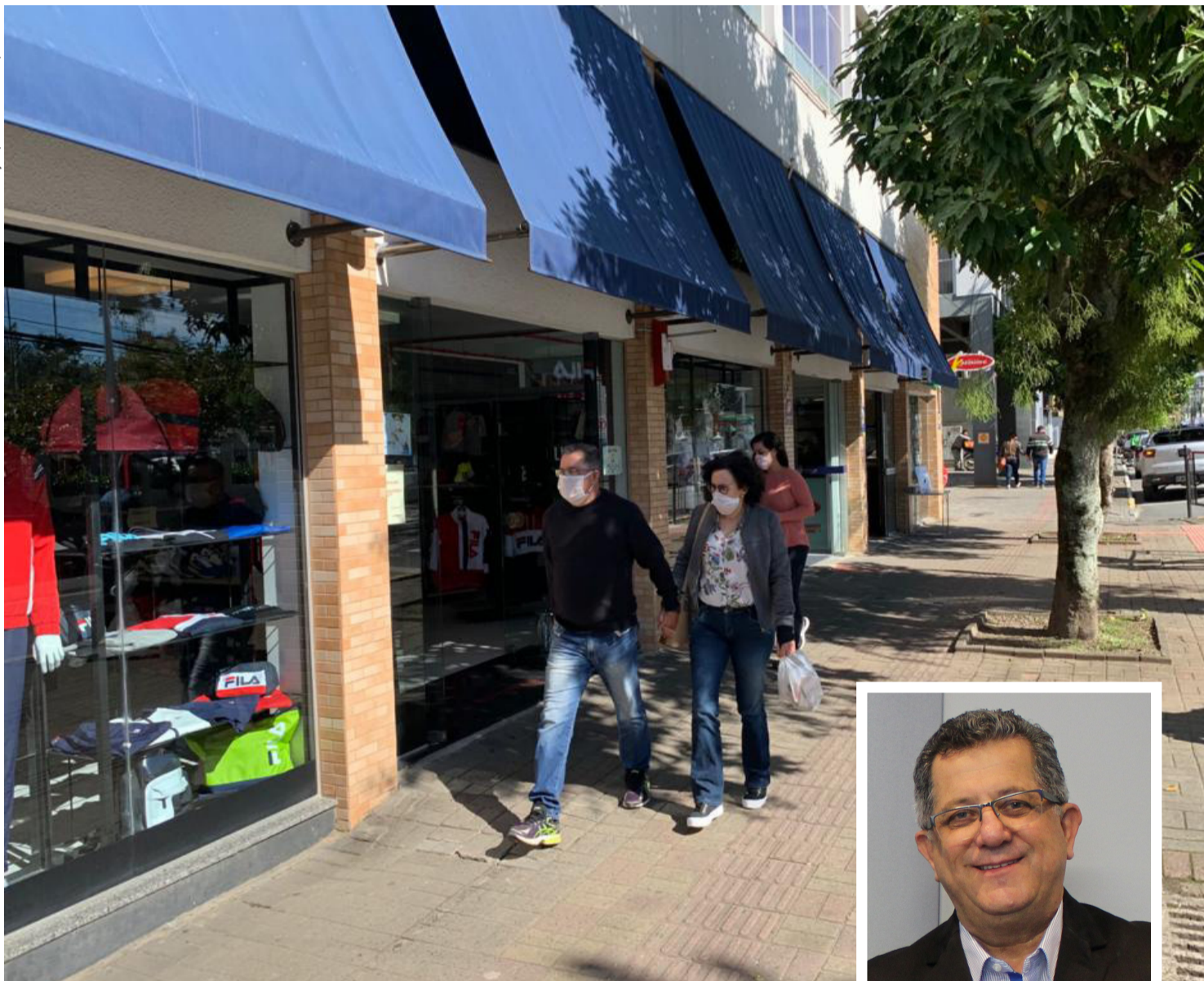
Com mais dinheiro no bolso dos servidores, lojistas esperam lucrar com as vendas de produtos