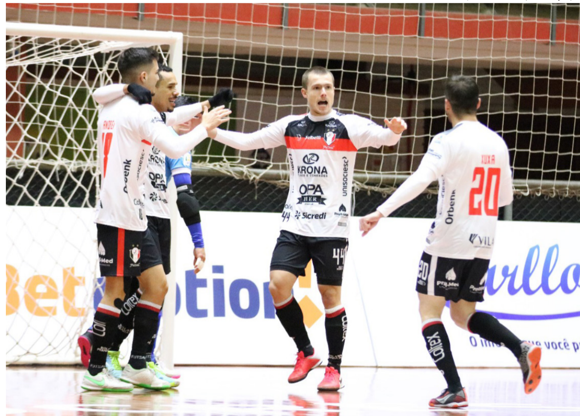
O JEC/Krona marcou dois gols nos dois primeiros minutos do jogo. A partir daí administrou a pressão e segurou a vitória fora de casa