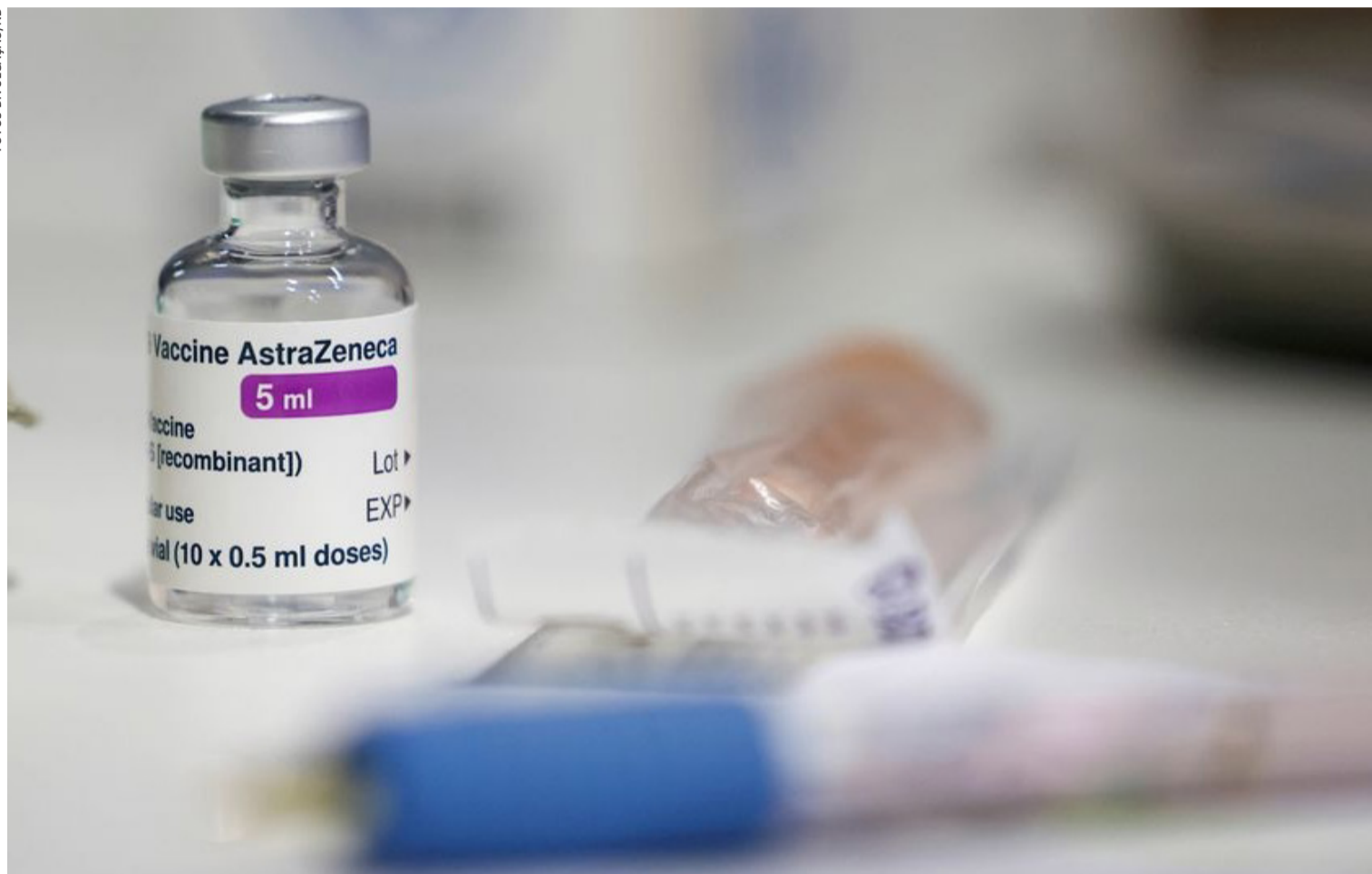
Segundo dados do Vacinômetro, o Brasil aplicou 2,2 milhões de doses de vacinas contra a Covid-19 nas últimas 24 horas