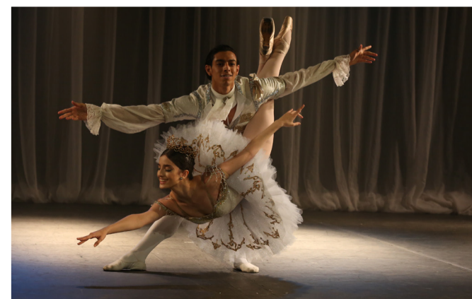
Escola de Joinville é a única fora da Rússia que forma bailarinos