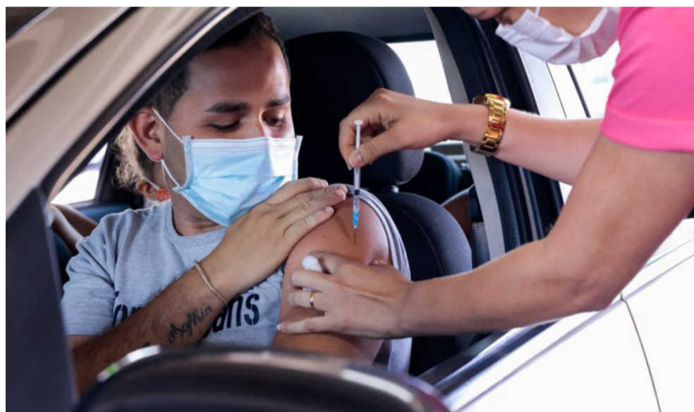
Do lote de mais de 257 mil doses recebidas pelo Estado, mais de 21 mil virão para Joinville e região

Desta forma, a fundação chega a 65,9 milhões de doses entregues ao PNI, incluindo as 4 milhões de vacinas importadas do Instituto Serum, na Índia. Só no mês de junho, foram fornecidos mais de 18 milhões de imunizantes. A Fiocruz tem ingrediente farmacêutico ativo (IFA) para entregas semanais da vacina até 23 de julho.