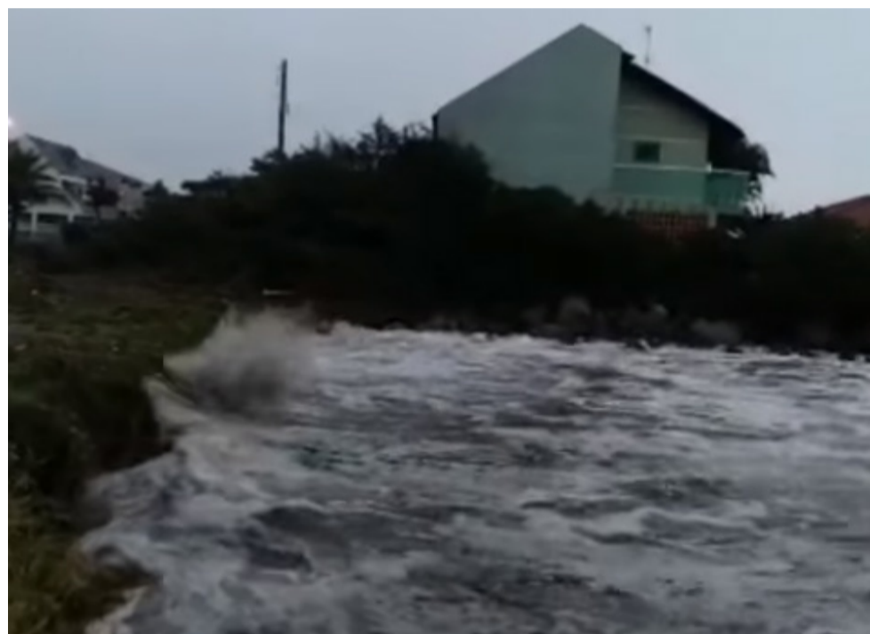
Algumas casas, construídas mais próximas da faixa de areia, ficaram cercadas pelas águas

Depois da onda de frio polar que atingiu o Estado de Santa Catarina e fez as temperaturas despenca-rem, agora é a passagem de uma tempestade subtropical que desperta a atenção dos moradores.