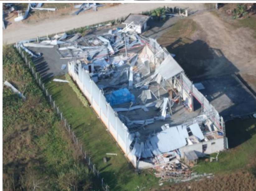
Passagem de ciclone bomba por Garuva destelhou milhares de imóveis e deixou a cidade sem energia por sete dias. Recuperação exigiu empenho de toda a população

Apesar de todo o investimento e reconstrução do município, ainda há trabalho a ser feito. O município prevê a construção de 11 casas com isolamento térmico e capacidade de suportar ventos de até 170 km/h. A prefeitura garante que os recursos já estão previstos, mas as obras dependem de licitação que é realizada pela Defesa Civil. O primeiro processo foi impugnado por uma das empresas concorrentes e, agora, novo processo deve ser aberto.