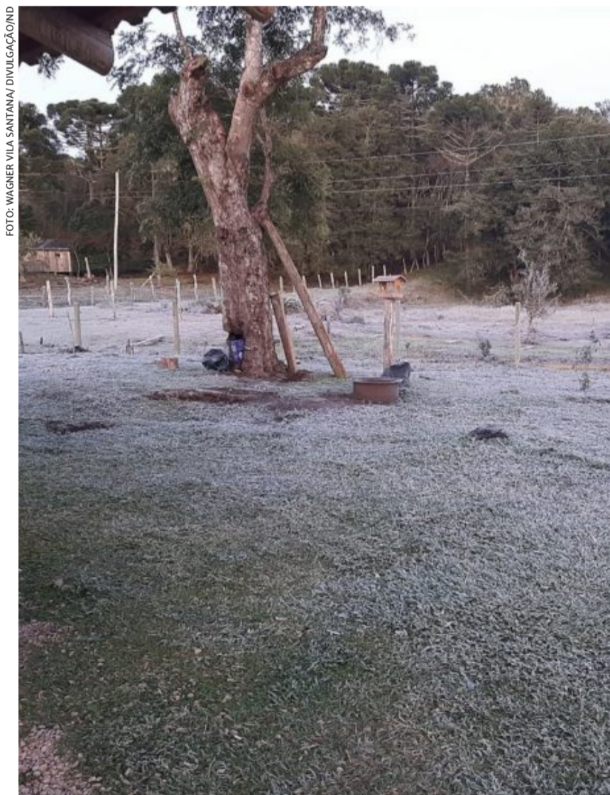
Geada voltou a aparecer no Planalto Norte ontem em razão das baixas temperaturas

Segundo a previsão da Epagri/Ciram, o amanhecer desta quinta-feira ainda será de temperaturas baixas. As mínimas oscilarão entre -4°C e 4°C, com formação de geada mais forte do Oeste ao Planalto, e de forma isolada no Alto Vale do Itajaí e Florianópolis Serrana. No Litoral, ainda vai fazer frio com mínimas de 6°C a 10°C na maioria dos municípios.