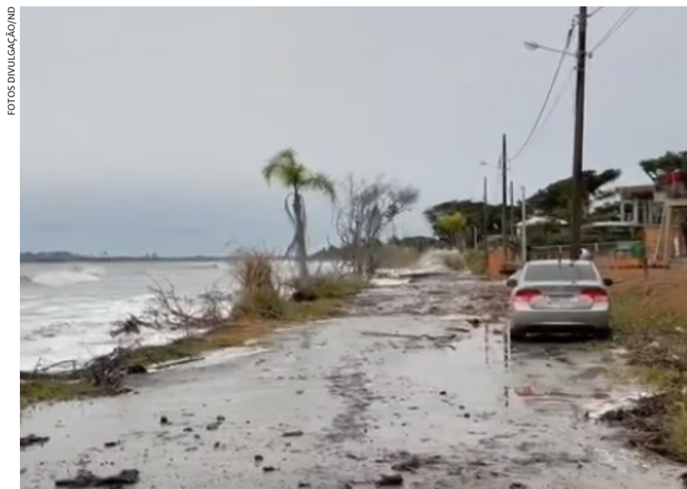
Em Itapoá, no Litoral Norte, avanço do mar começou no fim de semana e destruiu parte da orla

Fenômeno que se formou no oceano é considerado raro para esta época do ano e se caracteriza por ventos fortes e ondulação mais elevada. Por conta disso, a navegação de embarcações de pequeno e médio porte é desaconselhada