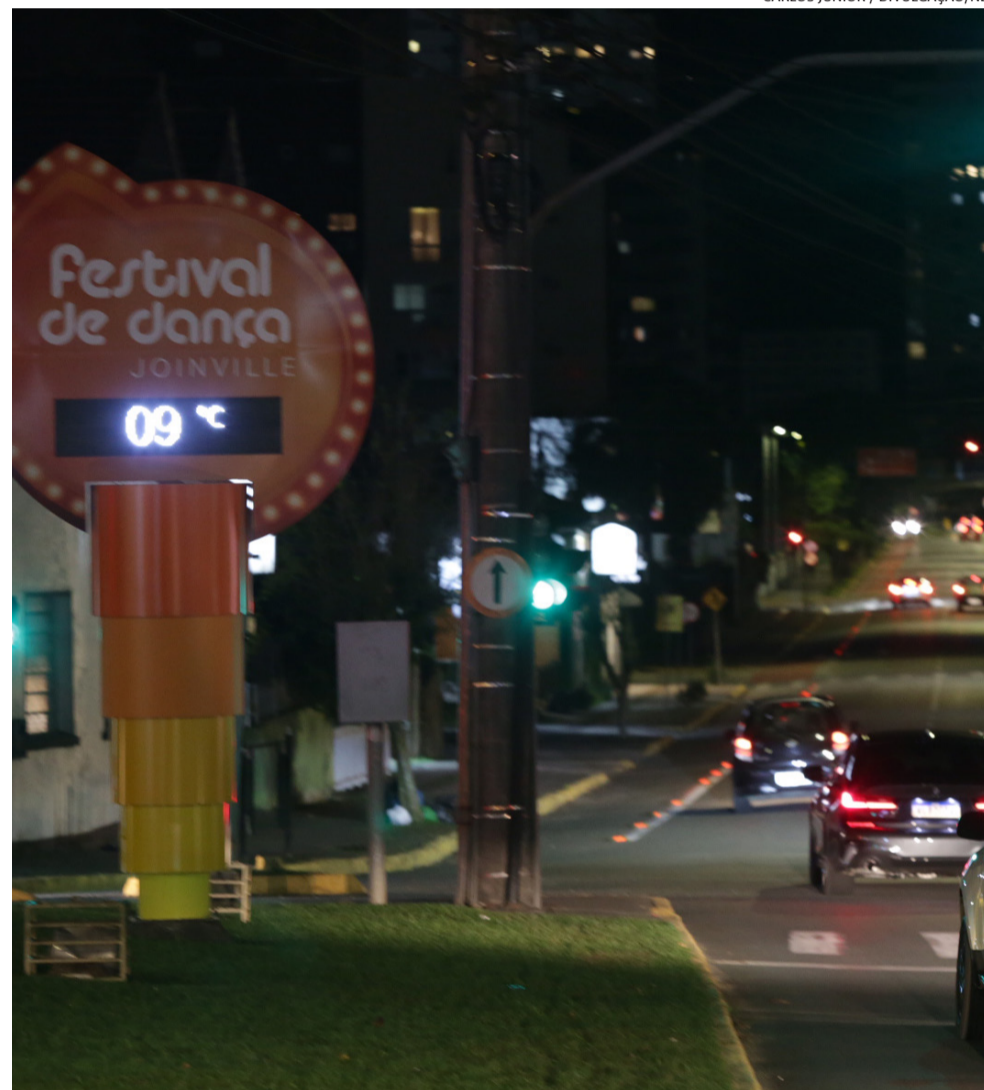
No início da noite de ontem, termômetro na região central da cidade já marcava 9°C

A semana vai começar gelada em Joinville e região Norte do Estado. Segundo a meteorologista Francine Sacco, da Defesa Civil de Santa Catarina, a mínima prevista na cidade fica em torno de 5°C. Já no Planalto Norte, a previsão é de termômetros negativos, em torno de -3°C.