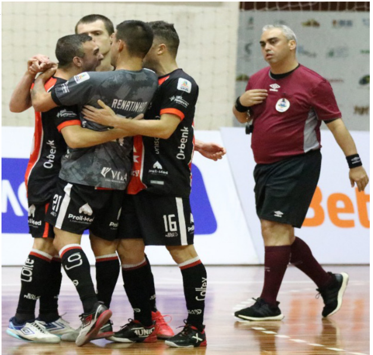
JEC/Krona usou a estratégia do goleiro linha para equilibrar o confronto e até passar à frente no placar contra a equipe gaúcha