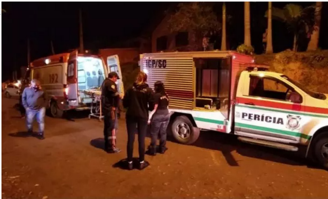
Bombeiros e peritos da Polícia Civil estiveram no local para prestar socorro às vítimas e recolher provas do acidente