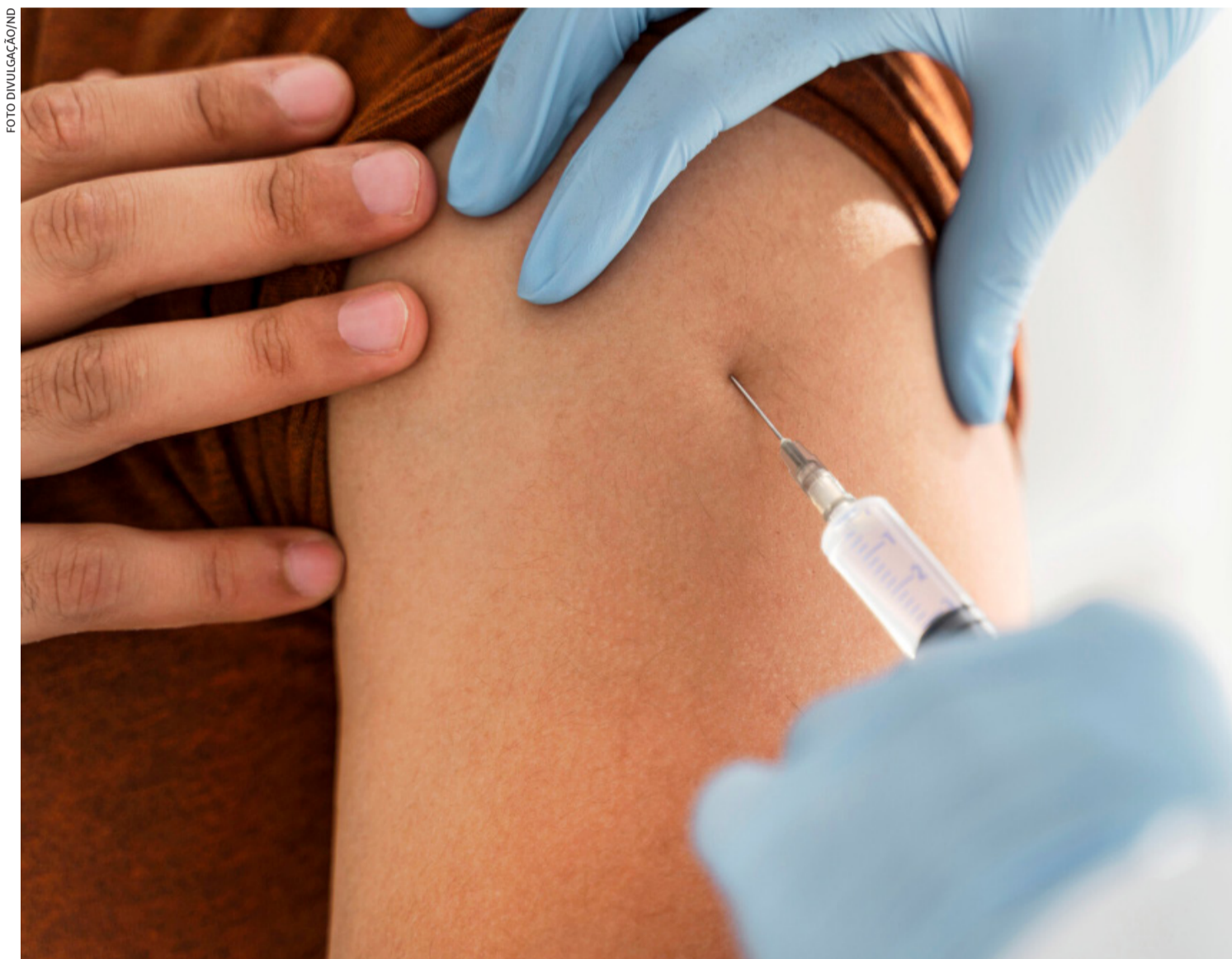
Enquanto novas doses não chegam, a Secretaria de Estado da Saúde decidiu remanejar 125 mil doses da vacina AstraZeneca que estavam guardadas

A SES também distribuirá 63.100 doses da vacina CoronaVac para aplicação da segunda dose, para garantir que os esquemas iniciados no dia 25 de junho sejam completados.