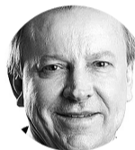
Celso Maldaner Presidente do MDB Santa Catarina e deputado federal

Há anos uma crise de representatividade vem minando a confiança dos brasileiros em nossa ainda jovem democracia. Uma pesquisa realizada pelo Instituto Ipsos em 2017 mostrou que 94% dos brasileiros não se sentem representados pelos políticos. Em outra pesquisa, realizada pelo Datafolha em 2019, 65% dos entrevistados afirmaram não ter um partido político com que se identifiquem. E aqui no Sul do Brasil é ainda mais grave: 71% declararam não ter partido de preferência. Em 2020, o Pew Research Center realizou estudos em 27 países sobre a satisfação dos cidadãos com a democracia e, no Brasil, 83% das pessoas se declararam insatisfeitas. Esses são apenas alguns números alarmantes que revelam que a população não se sente representada por quem elegeu e por quem está no poder.