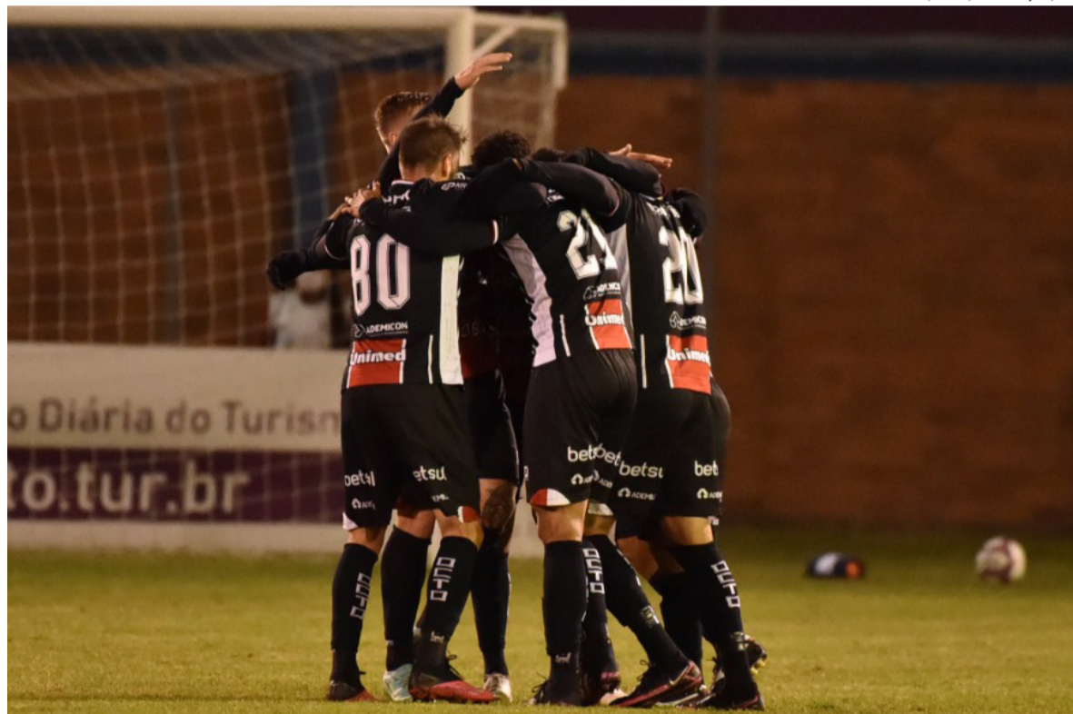
Joinville acumula quatro vitórias e três empates até agora na Série D